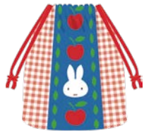
●キャンディ入りミニ巾着(約タテ15×ヨコ13cm、キャンディ7個入) 1,404円