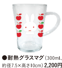
●耐熱ガラスマグ(300ml、約径7.5×高さ10cm) 2,200円