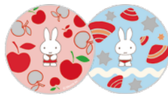
●アクリルコースター(全2種、直径9cm) 各968円